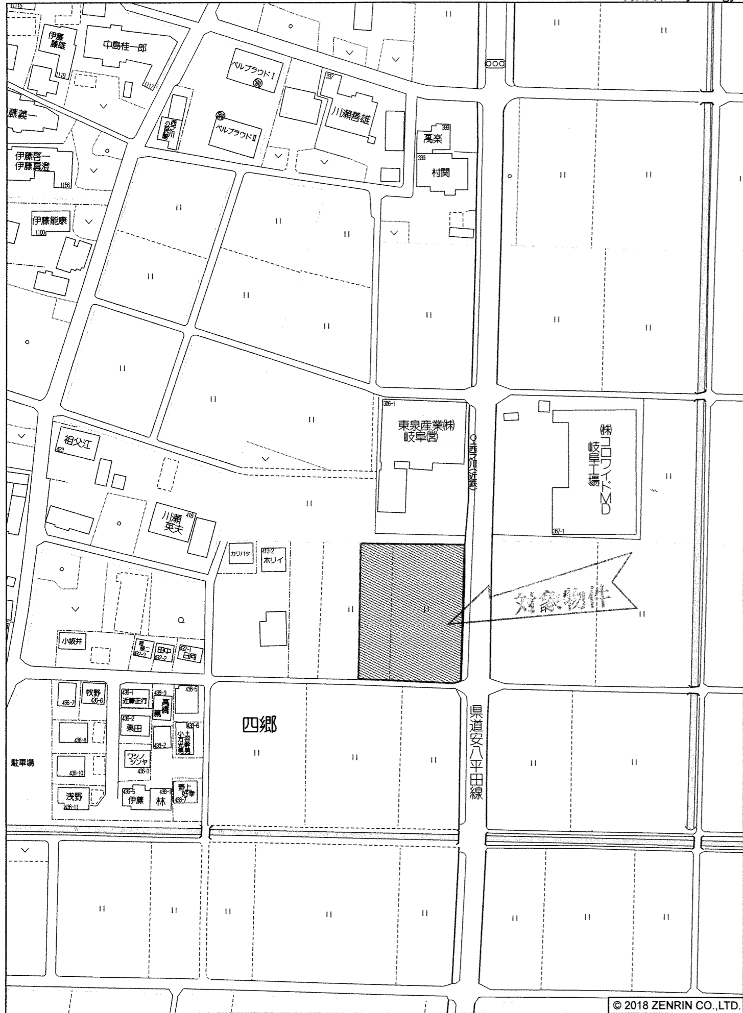
輪之内町四郷付近