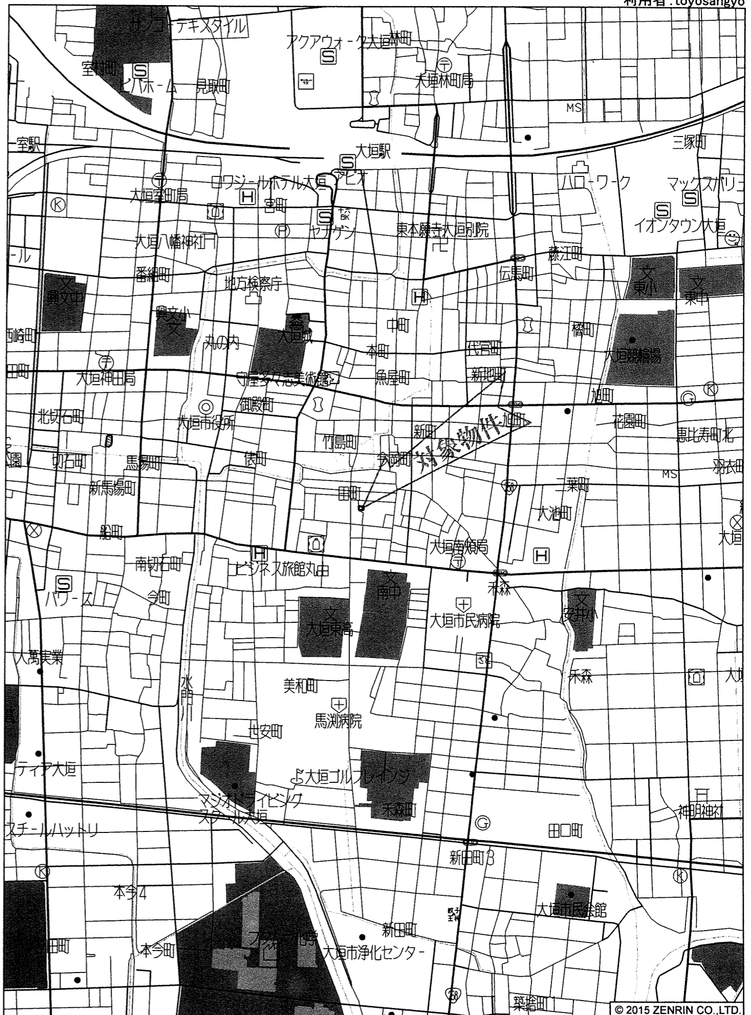
大垣市南瀬町付近