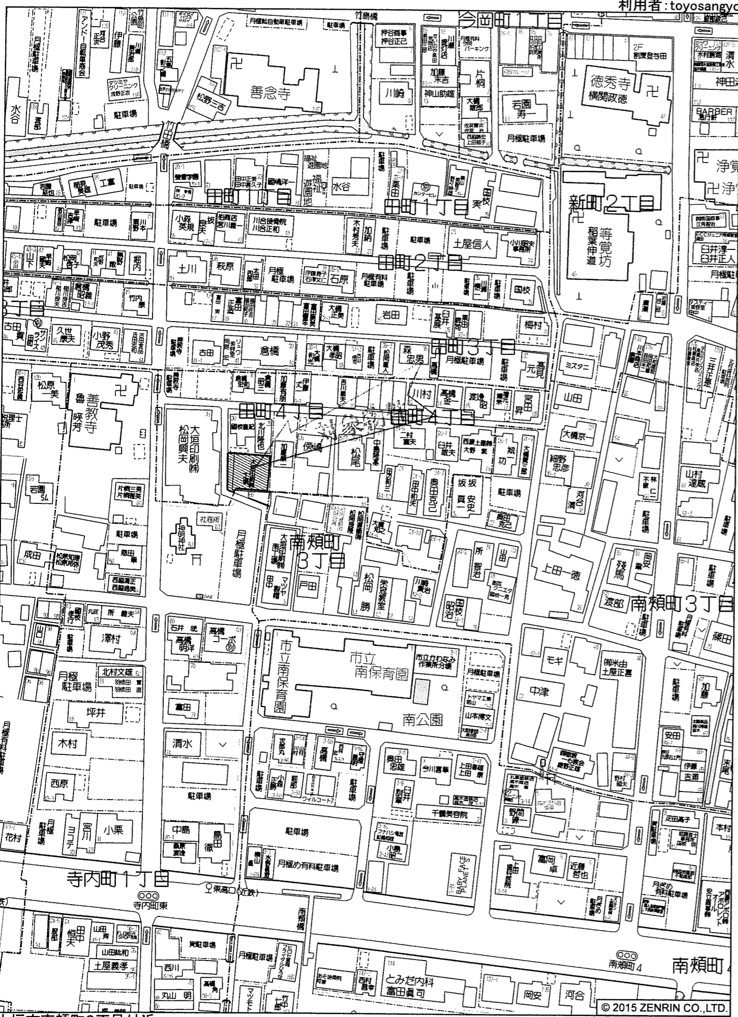
大垣市南類町3丁目付近