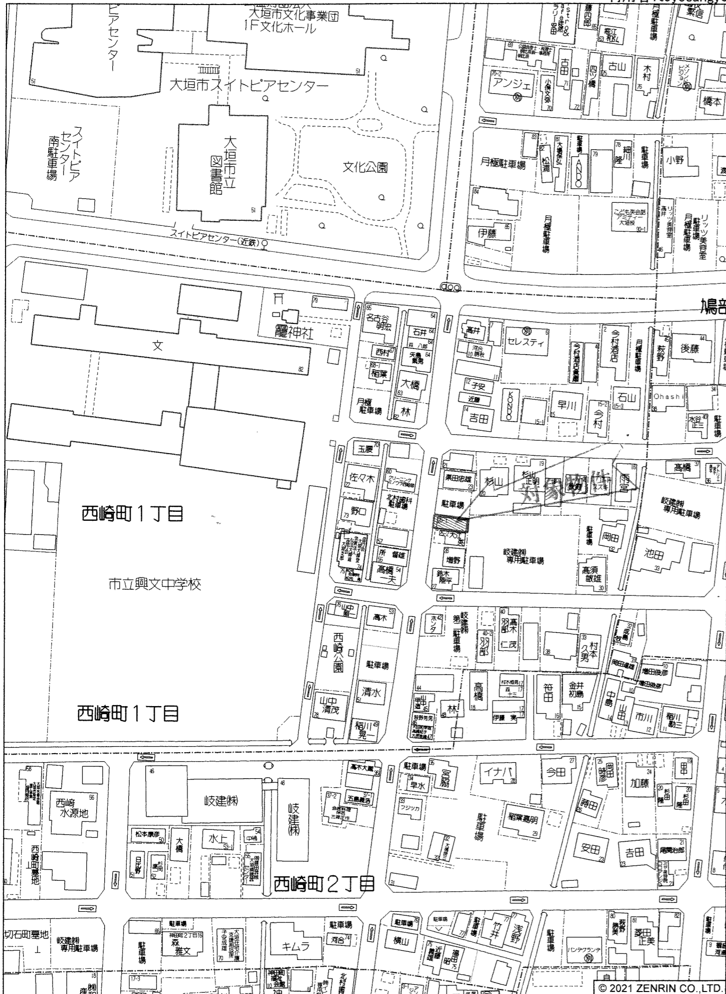
大垣市西崎町1丁目付近