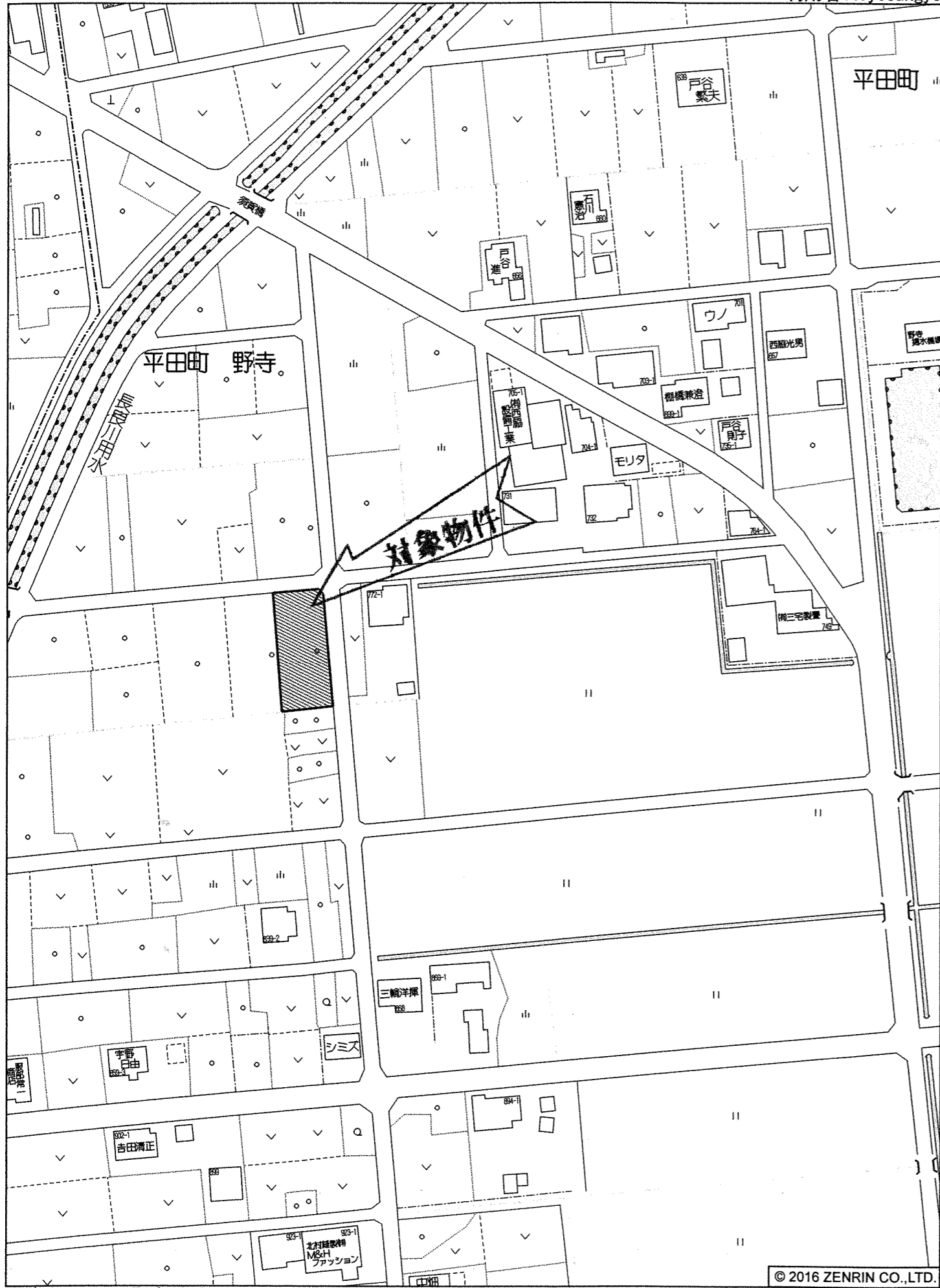
海津市平田町 野寺付近