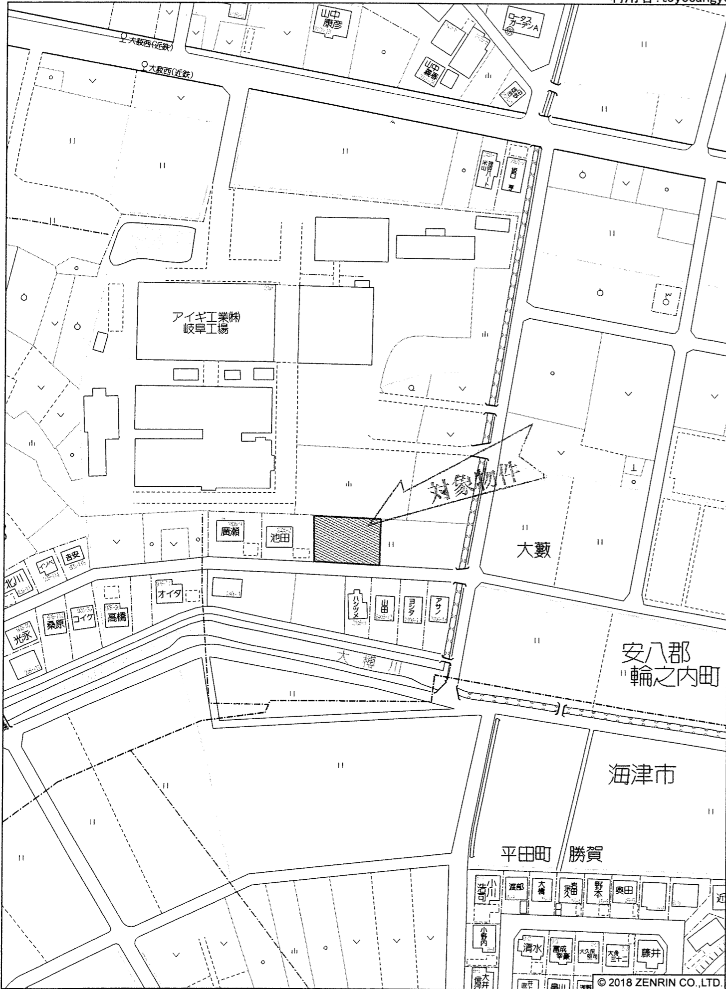
輪之内町大藪付近