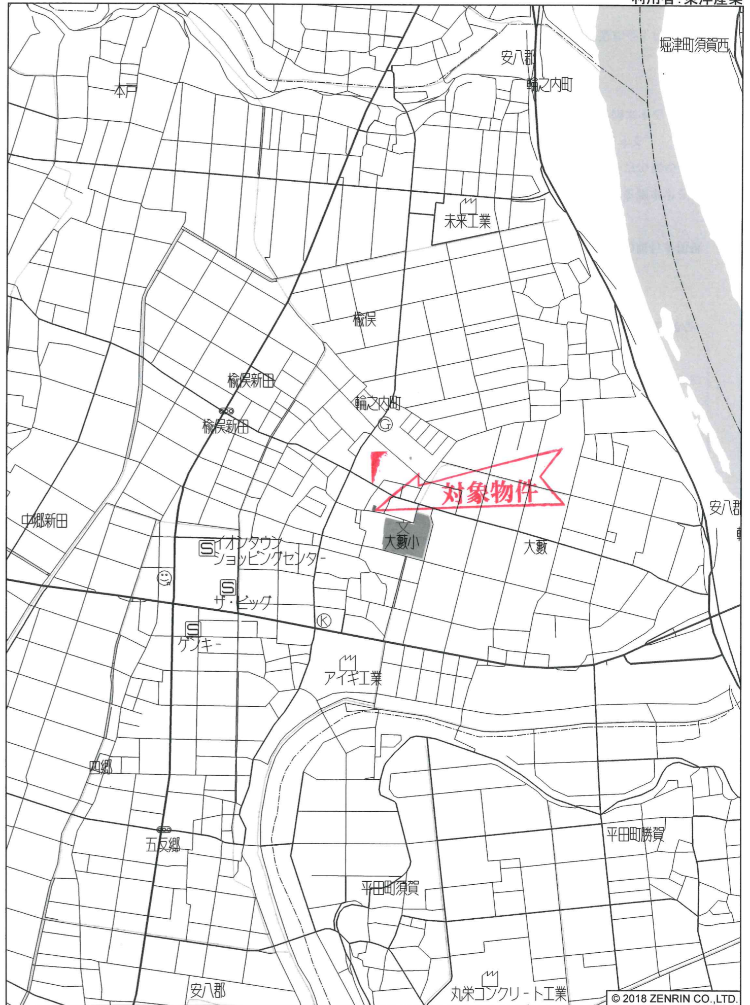
輪之内町大藪付近