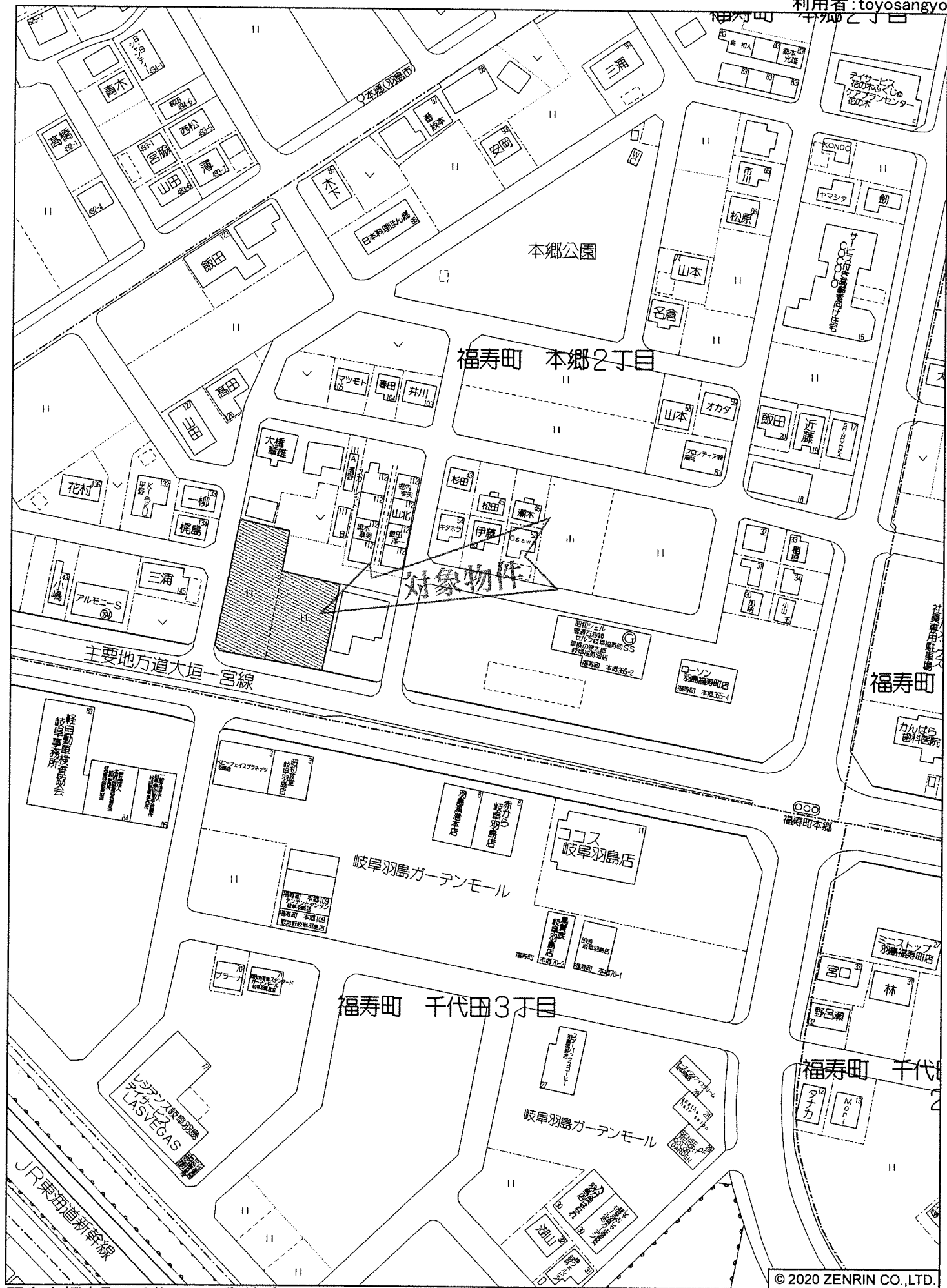
羽島市福寿町 千代田3丁目付近