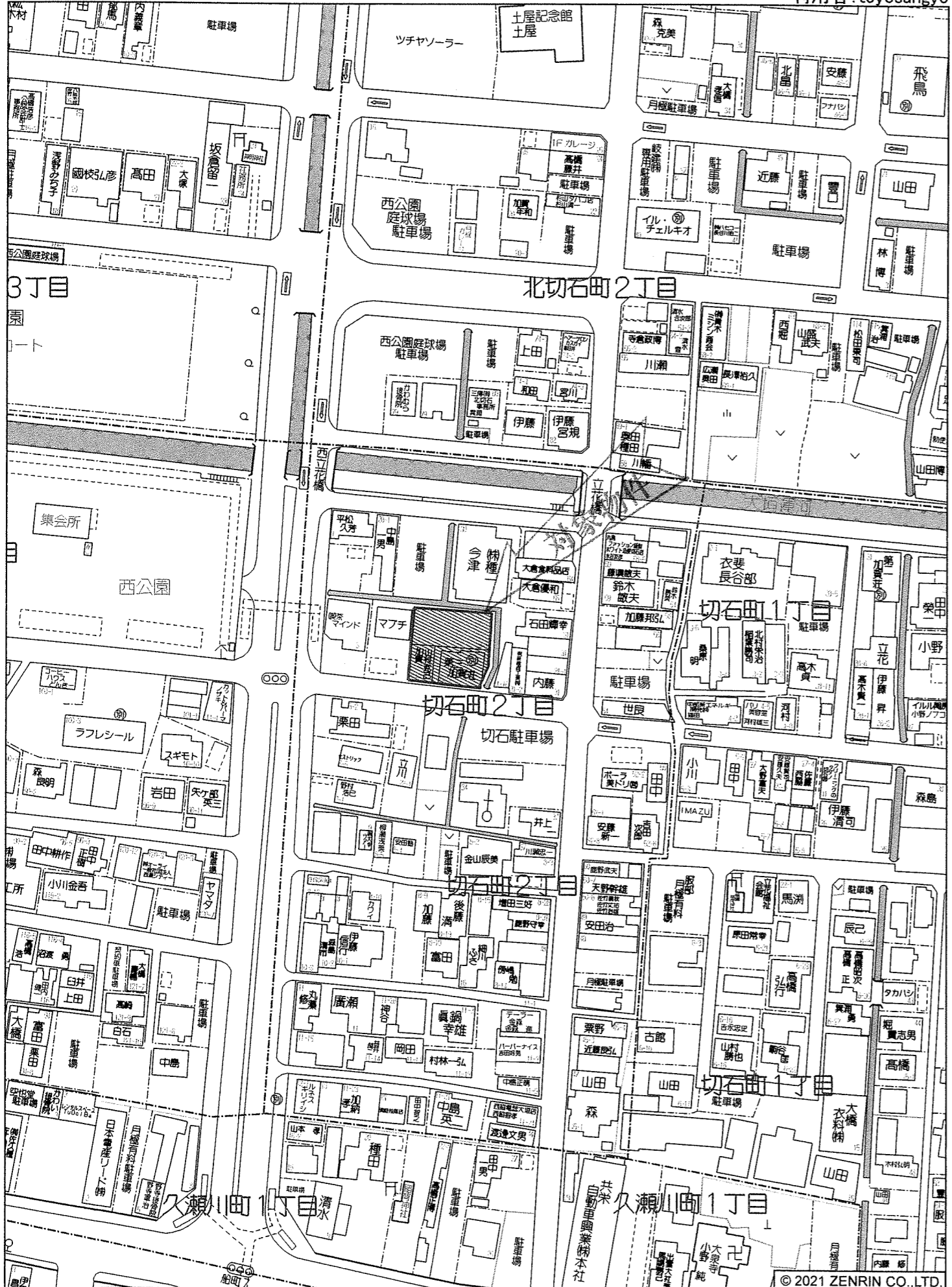
大垣市切石町2丁目付近