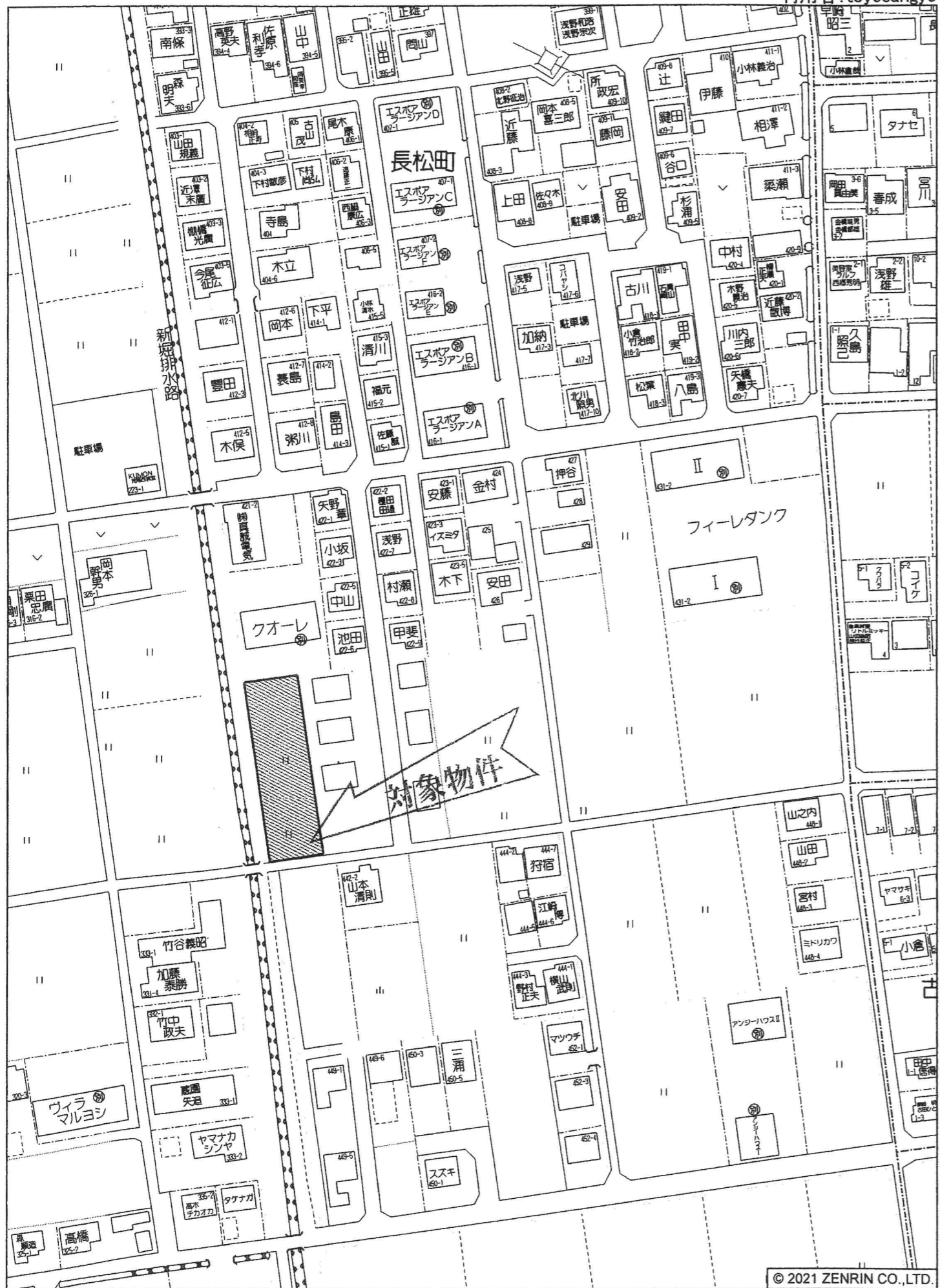
大垣市長松町付近