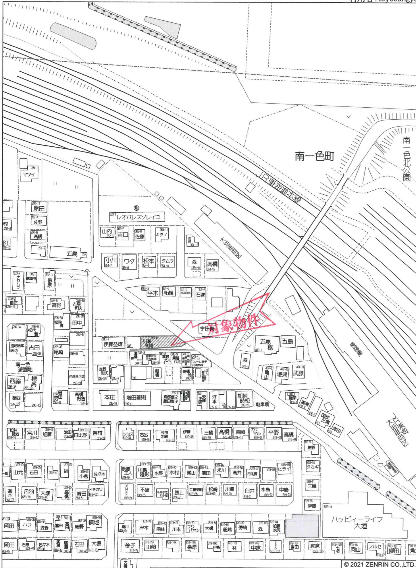
大垣市南一色町付近