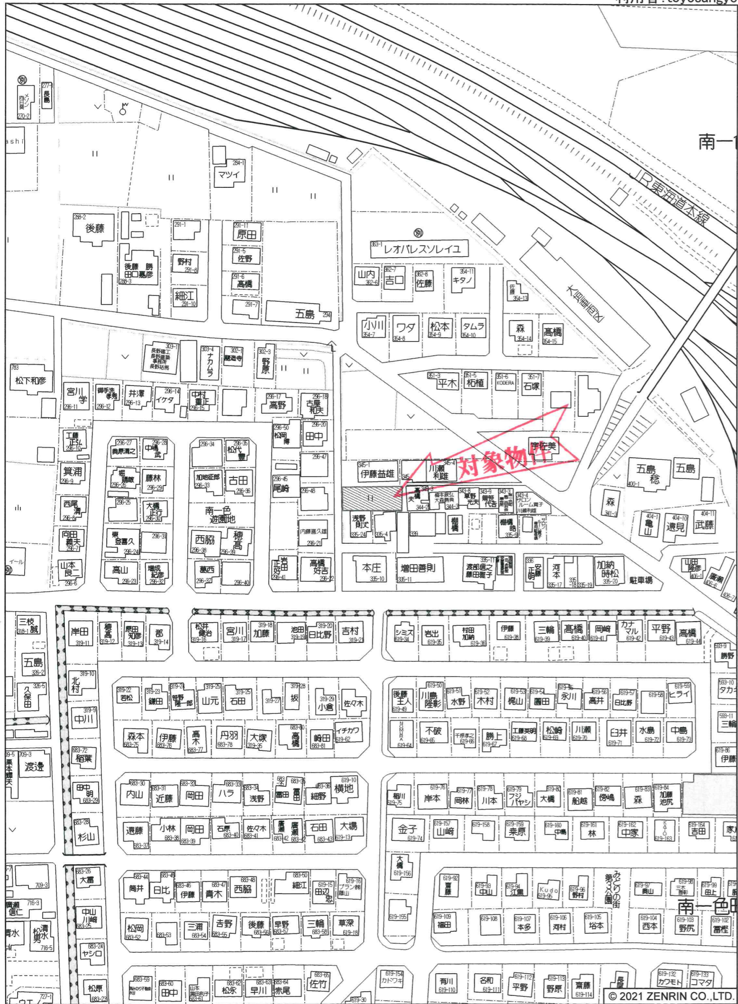
大垣市南一色町付近